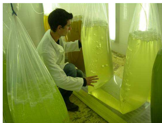
Culture de micro-algues