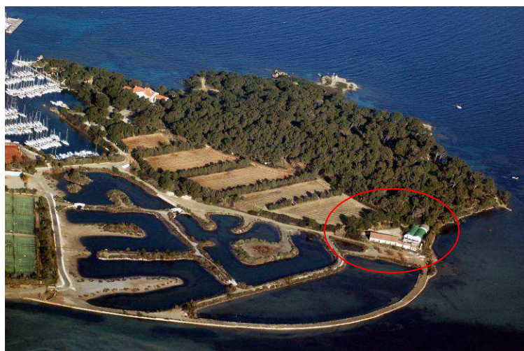
L'écloserie est implantée sur le site du Centre de recherche de l'Institut océanographique Paul Ricard, sur l'île des Embiez (Var), à proximité de la lagune du Bruscat et d'anciens marais salants aménagés en bassin expérimentaux.